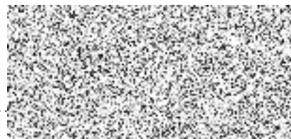
předsedkyně Klubu Kamarád z. s.